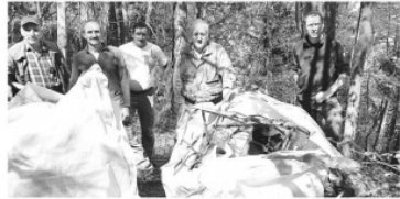
Hubertusfreunde Turmtal. Abfälle an Strassenböschungen oder in einem abgewendeten Waldstück zu sammeln, ist eine spezielle Hegearbeit.

TURTMANN/UNTEREMS | Die Hubertusfreunde aus dem Turmtal trafen sich zum diesjährigen Hegetag wieder in Unterems. Das Ziel war, weiteren Abfall im Wald zu räumen.