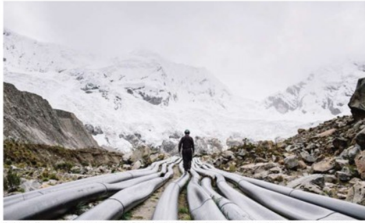
Un des surveillants présents en permanence au lac Pakoashu, dans les Andes péruviennes, qui menace de débordement.