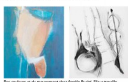
Des couleurs et du mouvement chez Angèle Ruchti. Elle y travaille depuis vingt ans, notamment à Anzère. ©

ressantes dans leurs agencements rythmiques et musicaux. Inspiration dans la nature et dans ses forces élémentaires L'artiste d'Anzère s'inspire beaucoup de la nature, de «ses formes multiples, ses éléments pulsionnels et ses paramètres géométriques comme les parallélogrammes, les triangles, les cercles, les carrés, les rectangles, les ovales, les triangles, les pentagones, les hexagones, les heptagones, les octogones, les nonagones, les décagones, les hendécagones, les dodécagones, les tétraèdres, les pentagones, les hexagones, les heptagones, les octogones, les nonagones, les décagones, les hendécagones, les dodécagones...» Pour la première fois depuis des années, elle présente également des dessins.