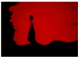
Quattro dettagli degli scatti notturni catturati dall'antropologo, fra cui "La Briga" in basso a sinistra