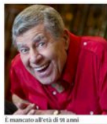
È mancato all'età di 91 anni

www.jorgepanchoaga.com www.sustainablemountainart.ch www.verzascafoto.com