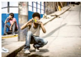
Cette photo du jeune tatin a été prise par Luana Letts. Il s'agit des coulisses d'un de ses projets culturels au Pérou. LUANA LETTS

Forcée dans une école d'art au Pérou puis du côté de Tenerife, la photographe est une artiste engagée qui se plaît à transmettre un message. «Je ne fais pas de l'art pour moi ou de l'art pour l'art. J'ai toujours pensé que mon travail devait parler de choses qui concernent les gens. En partant de là, j'ai voulu que travailler pour et avec la communauté est très gratifiant.» C'est dans ce sens que la jeune femme a développé et collaboré à plusieurs projets culturels en faveur de la jeunesse péruvienne. Elle a notamment travaillé sur la photo comme moyen de communication, avec des adolescents de milieux défavorisés. Du point de vue personnel, elle aime les paysages, l'architecture et l'impact de l'être humain sur ses créations qui attirent l'œil de la photographe. «Sur mes clichés, il y a une présence humaine mais elle ne se voit pas. Mon travail montre