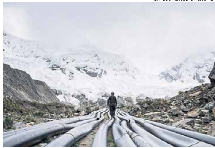
Solución provisional. Se ha instalado un sistema de sifones para aminorar el volumen de la laguna Palcacocha, pero el riesgo de inundación sigue.