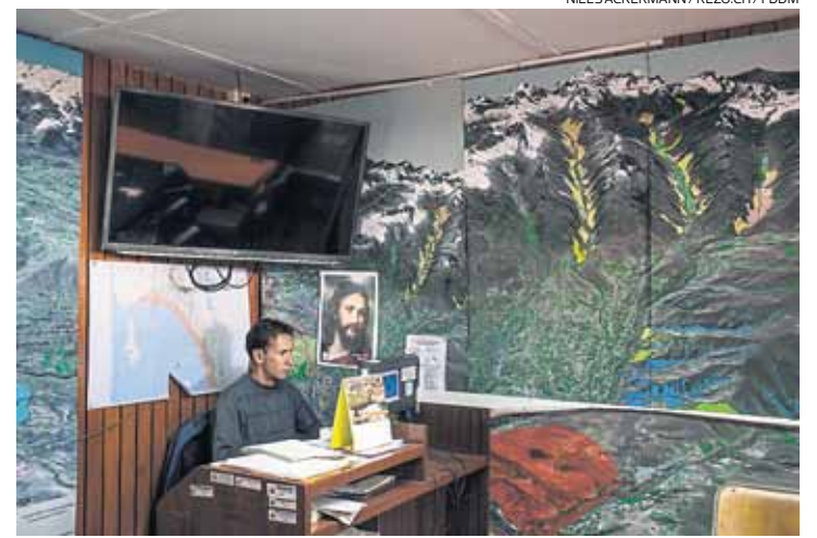
Alerta. Huaraz cuenta con un sistema de monitoreo permanente para informar de un posible desborde, pero su funcionalidad es cuestionable.