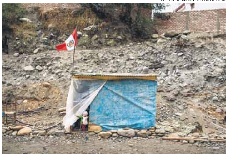
Riesgo. Mucha gente, en su mayoría migrantes que han llegado recién a Huaraz, se ha asentado a orillas del río, lo que pone sus vidas en peligro.